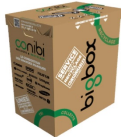
BIGBOX 150 litres 70 cm X 60cm X 40cm