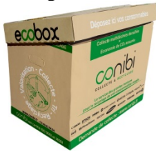
ECOBX 100 litres 45 cm X 60 cm X 40 cm

Dès la première collecte (*), nous vous livrons des contenants adaptés pour regrouper vos consommables usagés :